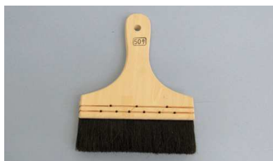
糊刷毛 木柄 ゴマ毛