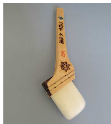
コロナ印水性刷毛 白毛