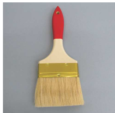
◎ 本水性コッピ塗柄