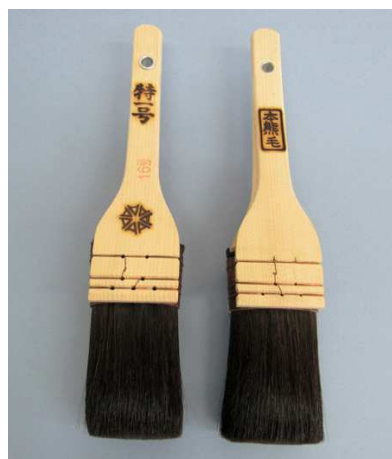
特1号 本熊毛 黒毛