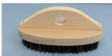
マークすり込み刷子 小判 (柄付)