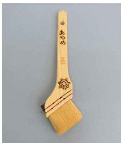
あやめ 白毛 (油性ウレタン用)