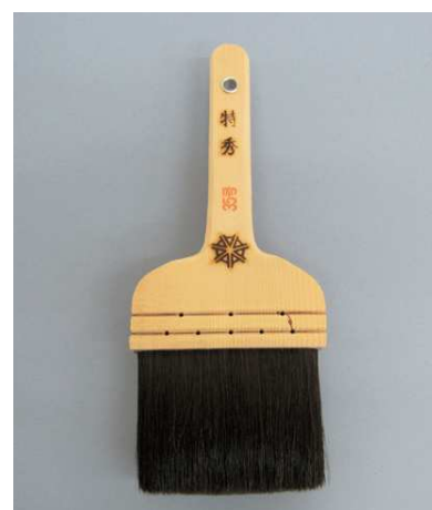
特秀 本熊毛 黒毛