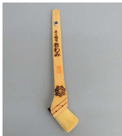
スミ切 きわみ 白毛