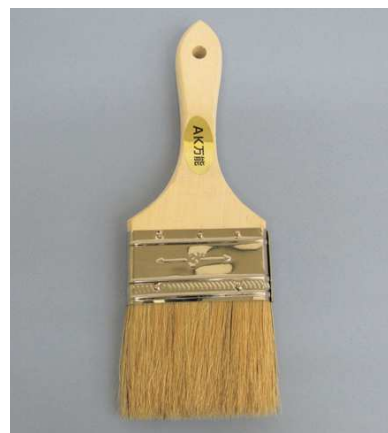
AK 万能刷毛 白豚毛