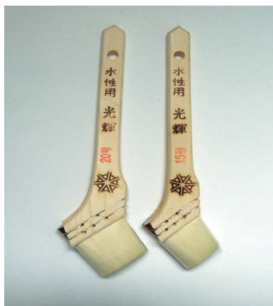
白ナイロン刷毛 光輝 水性用