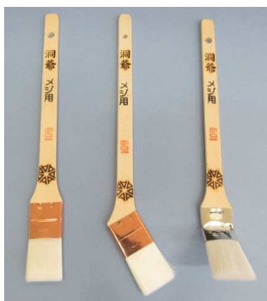
白ナイロン刷毛 洞爺 メジ用