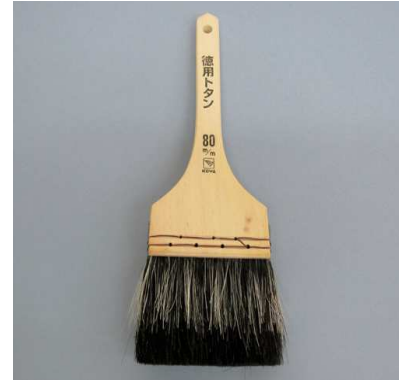
コーワ徳用トタン用 No. 19597 黒毛