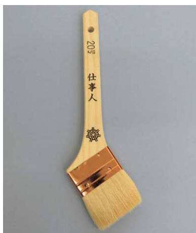
白毛 仕事人 (銅巻)