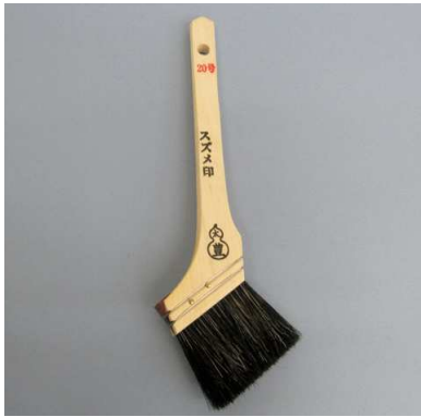
スズメ印 黒毛 (油性用)