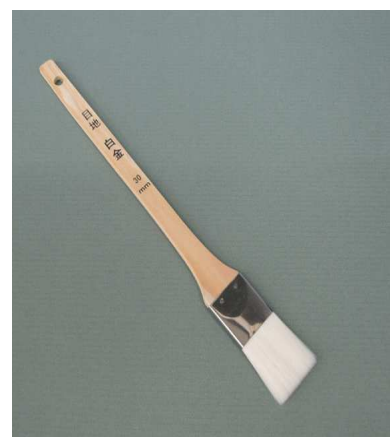
UT 目地刷毛 (ナイロン) 白金