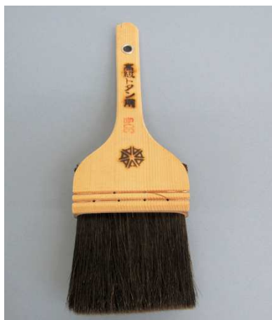
高級トタン用 黒毛