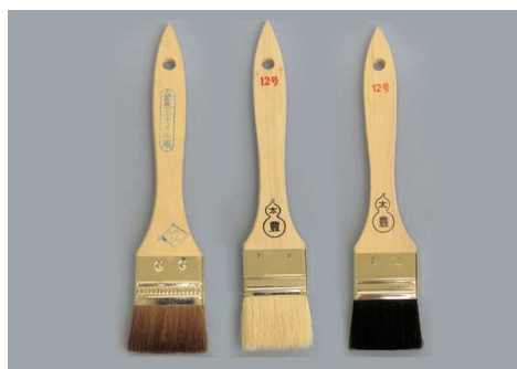
金巻エナメル刷毛