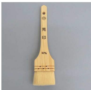
兎印ニス刷毛 白毛