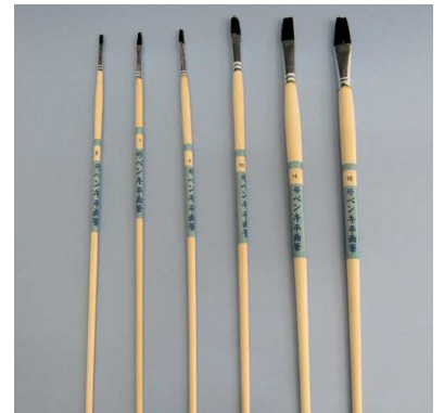
ペンキ平面筆 黒毛