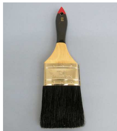
中国製コッピーエテルナ 黒毛