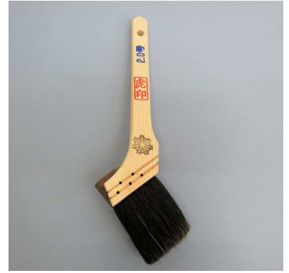
虎印 黒毛 (油性用)