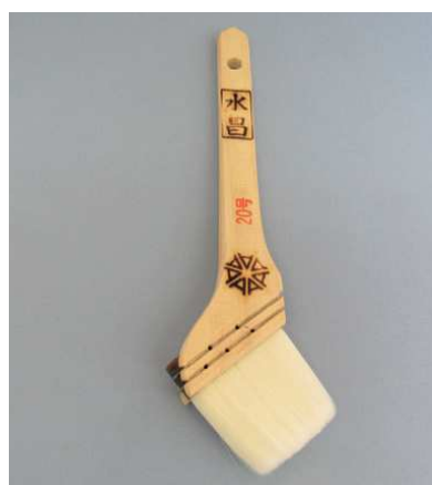
白ナイロン刷毛 水昌