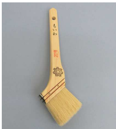
万能刷毛 もいわ 白豚毛