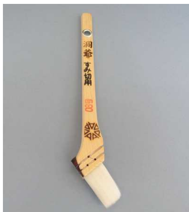
白ナイロン刷毛 洞爺 すみ切用