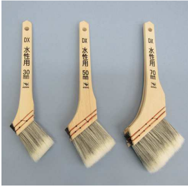
コーワ DX 水性用 白毛 + 黒毛