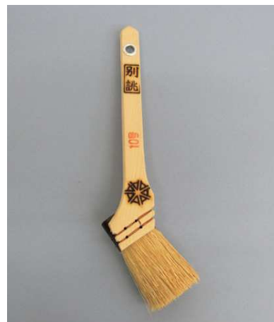
別誂 (パキンセメント)