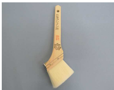
水性ウレタン用 木柄 白毛 (カシミロン)