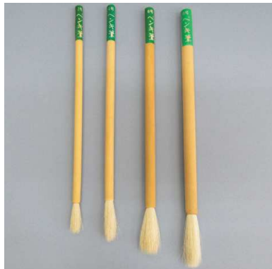
ペンキ筆 捌筆 白毛