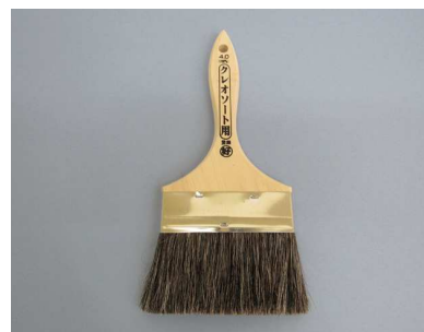
クレオソート刷毛 金巻ゴマ毛