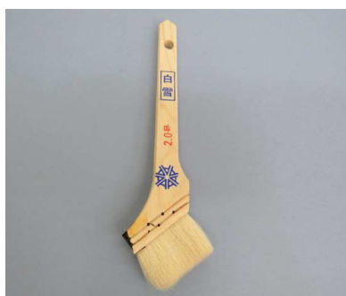
白雪印ニス刷毛 白毛