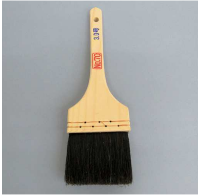
No. 70 トタンペンキ用 黒毛