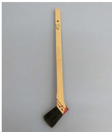
ペンキ用竹柄 黒毛