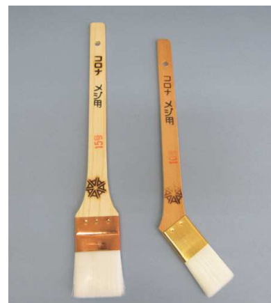
コロナ印 メジ用刷毛 (銅巻)