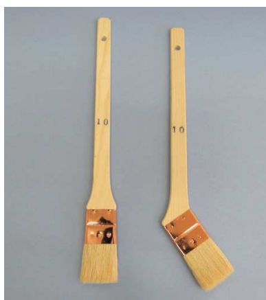
白毛 メジ刷毛 無印 (銅巻)