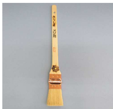
白毛メジ刷毛 きりしま