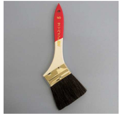
サニーペイント 黒毛 (油性・水性用)