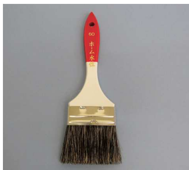
ホーム水性用 ゴマ毛