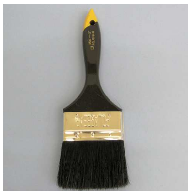
中国製コッピー 黒豚毛