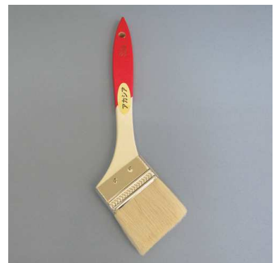
アカシア 白毛 (ニス・ペンキ用)