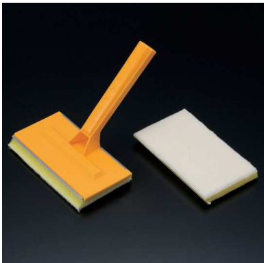
コーワ コテバケ平面用 スパア平面用