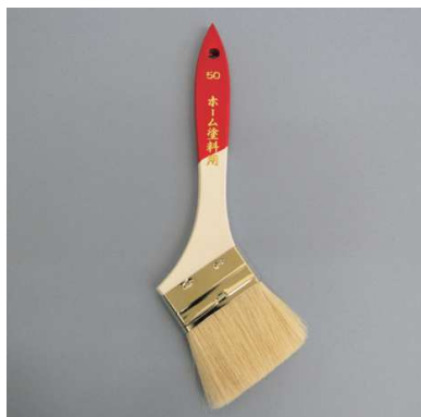
ホーム塗料用 白毛 (水性用)