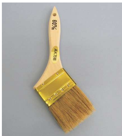
AK 万能刷毛 白豚毛