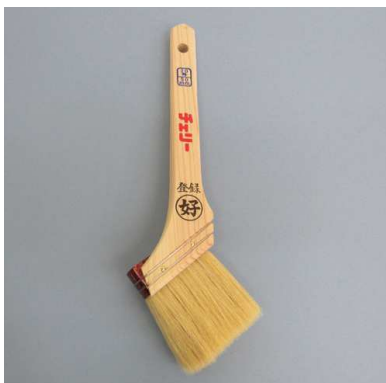
チェリー刷毛 白毛 (油性用)