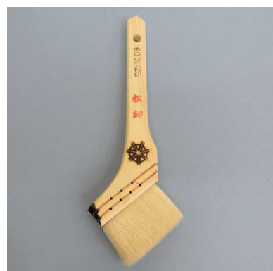
松印ニス刷毛 白毛