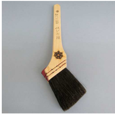
京ペンキ用 黒毛 (油性用)