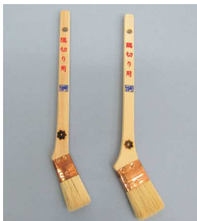
隅切り用 (銅巻) 白毛