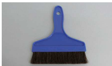
プラ柄糊刷毛 ゴマ毛