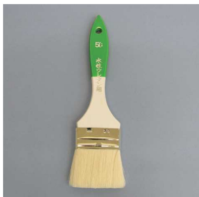
◎ 水性ウレタン (白毛) (カシミロン)