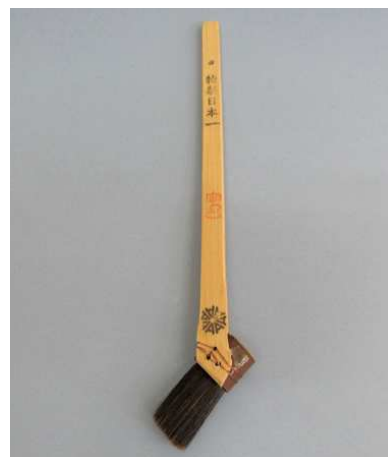
特製日本一印竹柄 黒毛