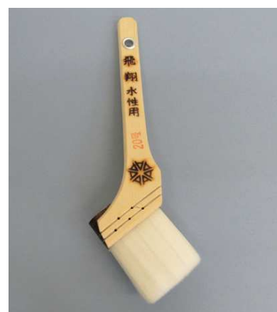
飛翔 水性用 白毛