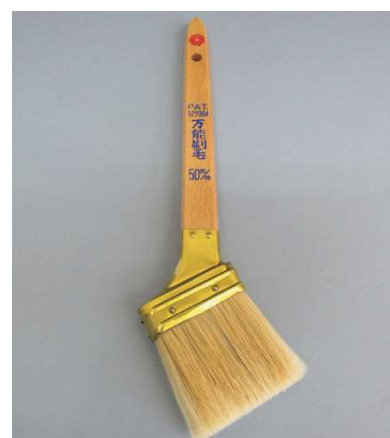
PAT 万能刷毛 白豚毛