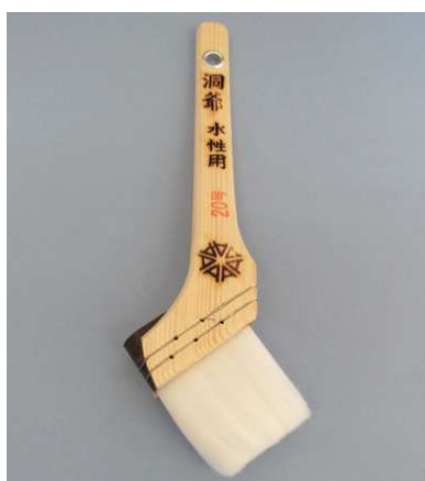
白ナイロン刷毛 洞爺 水性用