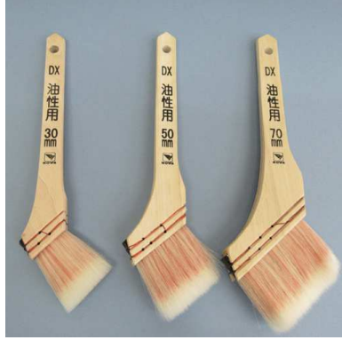
コーワ DX 油性用 白毛 + 赤毛