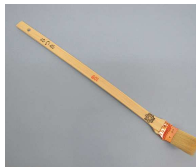
白毛ダクト用 さつき 先曲銅板長柄