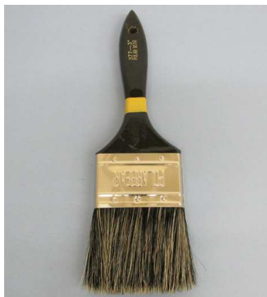
中国製コッピー ゴマ毛