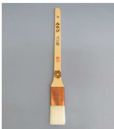
みやび目地ナイロン